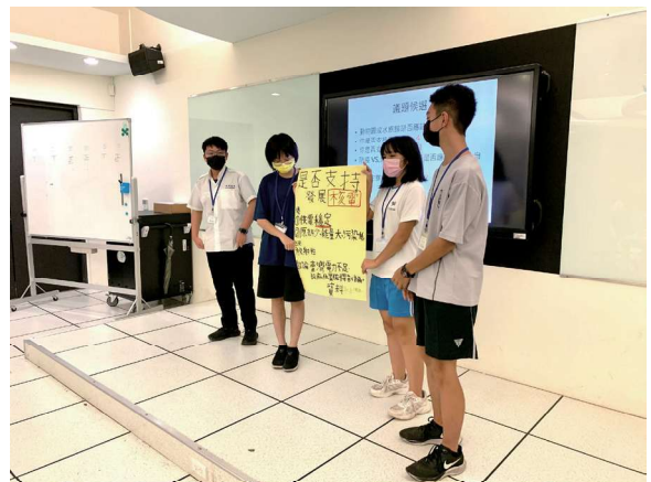
每堂課都有的上臺分享時間

8月雙方洽談合作模式並確認開課期程，9-10月進行課程規劃，11-12月正式執行課程。