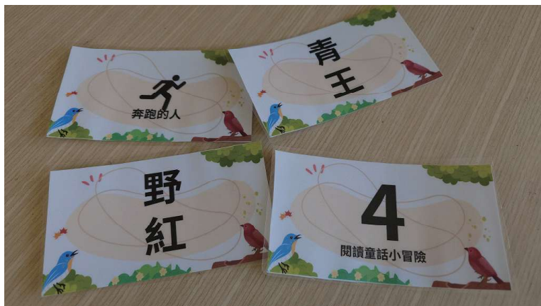
與書籍互動設計實境小卡，讓讀者可以自行闖關或是多人一起解謎。

閱讀互動感官體驗營系列活動規劃為主題展覽、感官體驗活動、手工藝活動及參訪。互動性的圖書館利用教育，展現圖書館不僅是靜態的知識空間，也是一個充滿可能性的學習場所。推廣閱讀平權是系列活動的核心，期待透過閱讀互動感官體驗營，讓鮮少接觸視障者的人能夠在黑暗中體會視障者的閱讀困境，理解缺乏視覺的不便之處。