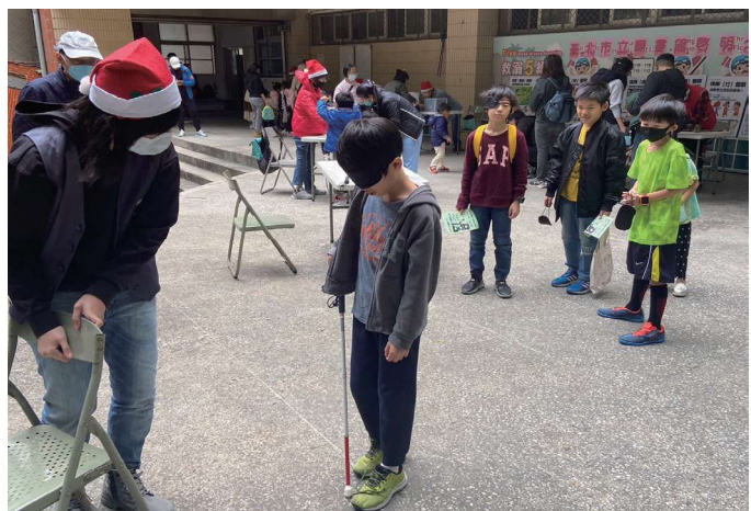
與周遭教育機構結合辦理館外體驗活動，透過實際使用白手杖模擬視障朋友的行走模式。

體驗活動打破傳統靜態模式，設計感官體驗，分布於館內不同區域。遊戲化形式大受好評，參與者也更願意聆聽視障平權的宣導，獲得相關知識。