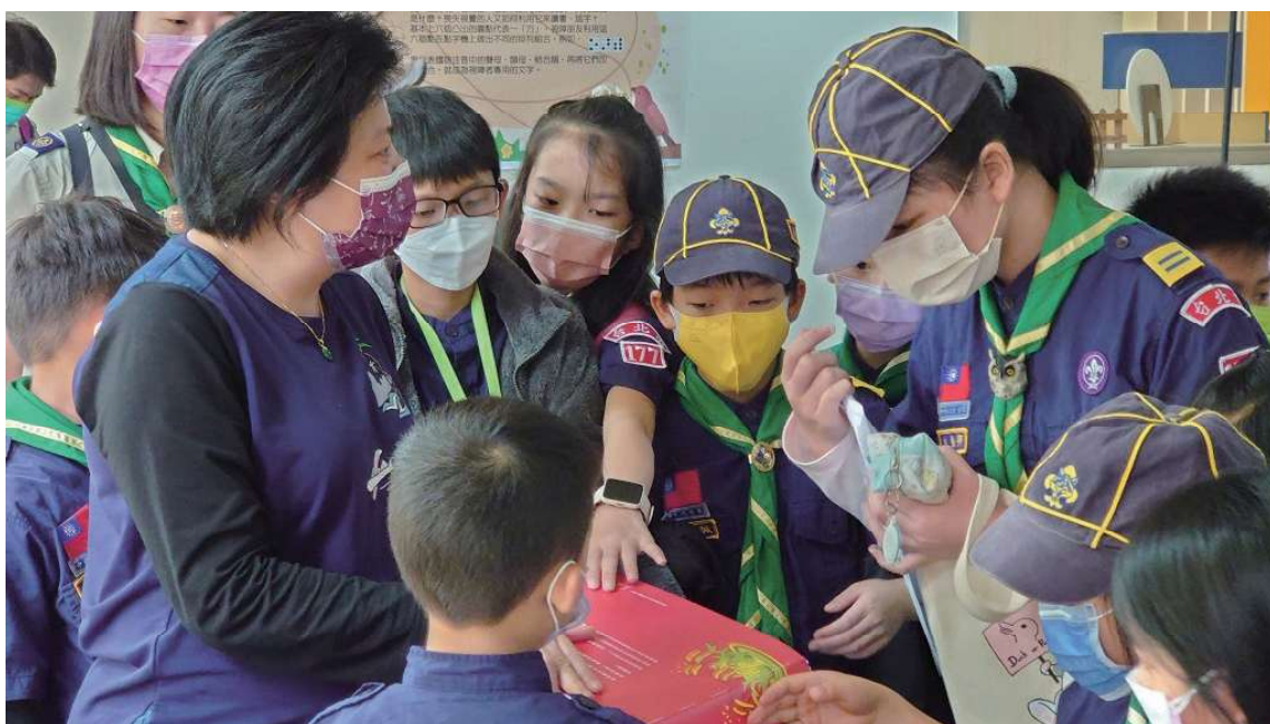
視障館員觸摸雙視圖書，將書籍內容結合參訪環節分享給到館參訪的來賓。