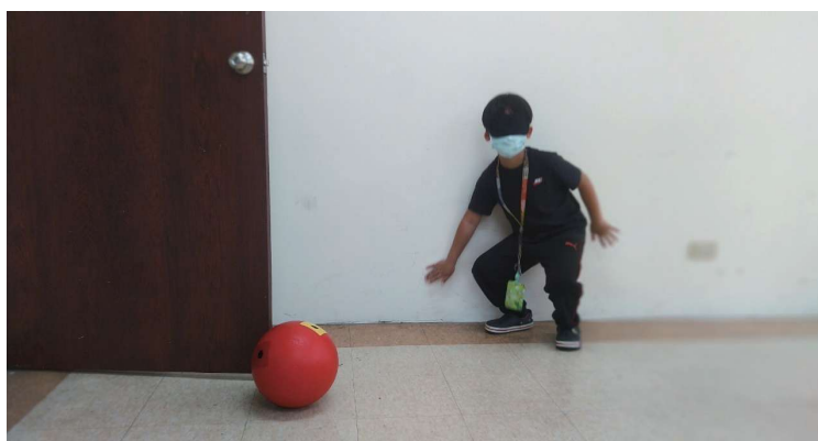
視障「運動」體驗使用有聲門球來進行活動，聲音與震動變成參與者辨識球體位置的重要資訊。