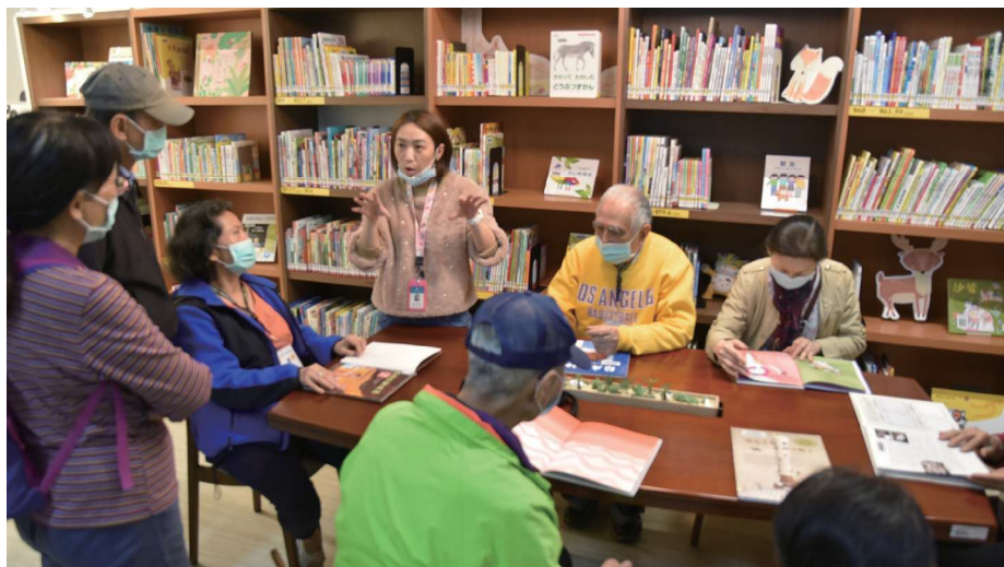
引導樂齡長者使用圖書館