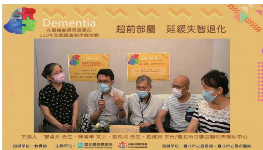
疫情期間透過線上辦理分享會

公共圖書館是離開學校正式教育後，重要的非正式學習場所，讓所有年齡層都可以自在交流經驗與知識，也能使獨居的年長者降低社會疏離感，透過各種活動或志工服務，促進其社會參與，是除了家庭、職場環境之外的重要「第三空間」。國臺圖透過不同類型多元閱讀推廣活動，包括主題展覽（含書展）、主題影談、名人講座、對談及徵稿活動等，在健康照護及青銀共融等多元高齡社會議題進行倡議，提升民眾關注及了解，盼營造高齡友善環境。