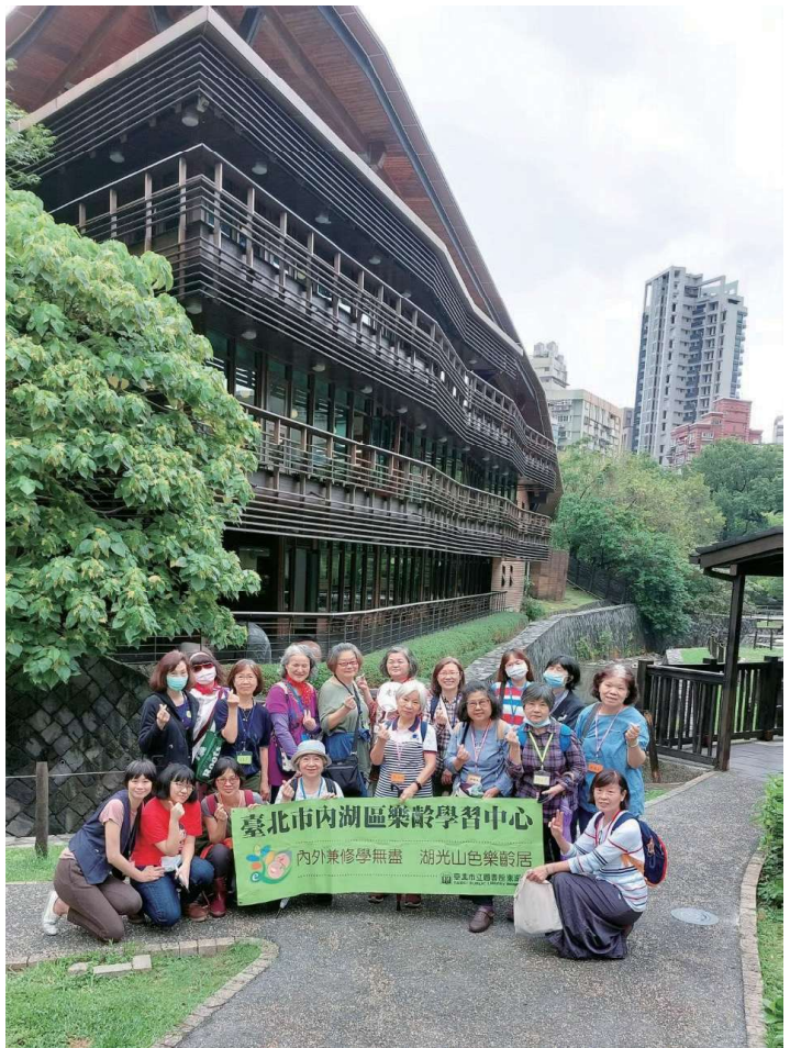
走讀初階班全員於北投分館合影

初階班安排北投溫泉區半日行，包含「北投公園」、「北投分館」、「溫泉博物館」、「梅庭」及「北投市場」等。北投圖書館特別安排導覽，讓學員更加認識北投分館集建築美學、環保、生態於一館的特色，也教導學員如何看索書號和查找館藏。講師鼓勵學員在自由時間去找一本自己有興趣的書，並分享感興趣的原因，做為本次參訪的實際收穫。