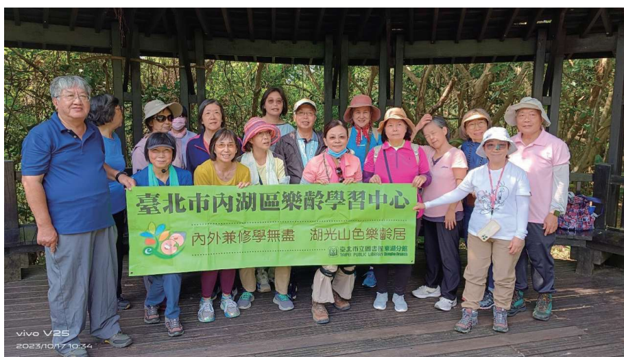
走讀進階班全員於劍南蝶園合影