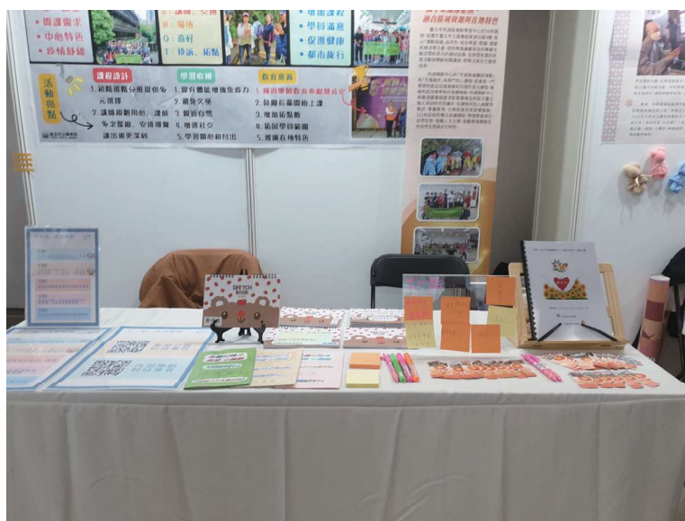
海報展攤位照片，當天展出進階班學員筆記（中）和初階班活動紀實（右），搭配互動小遊戲，請現場民眾推薦走讀行程，除了宣傳活動，也可以提供講師規劃課程。